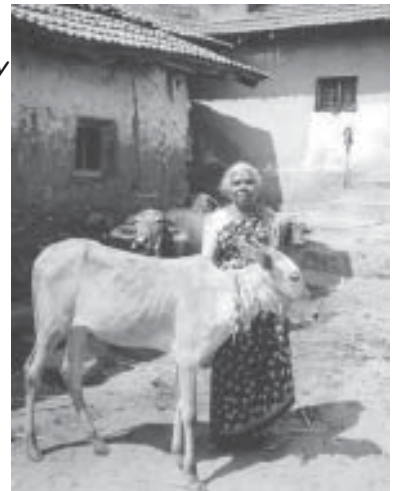
Mijn "Amma" in Hullenahally

Voor de liefhebbers van Indiaas eten volgen hier de recepten van twee gerechten die deel uitmaakten van onze "thali" op 5 december... de lijst met ingrediënten is vrij lang, maar laat dat je niet afschrikken want ze zijn heel simpel om te bereiden!