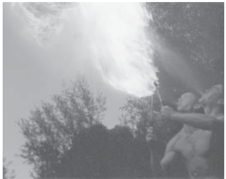
Willem (55) en ex-Droevendaler Rowan spuwen vuur tijdens het Droevendaalfeest. Foto: Anita (51)

Meer info op 31-33-35-43-47-51-69-93-95-101-103-105-107. Alle info bij Koen (105, koen@jnm.be ). Doen!