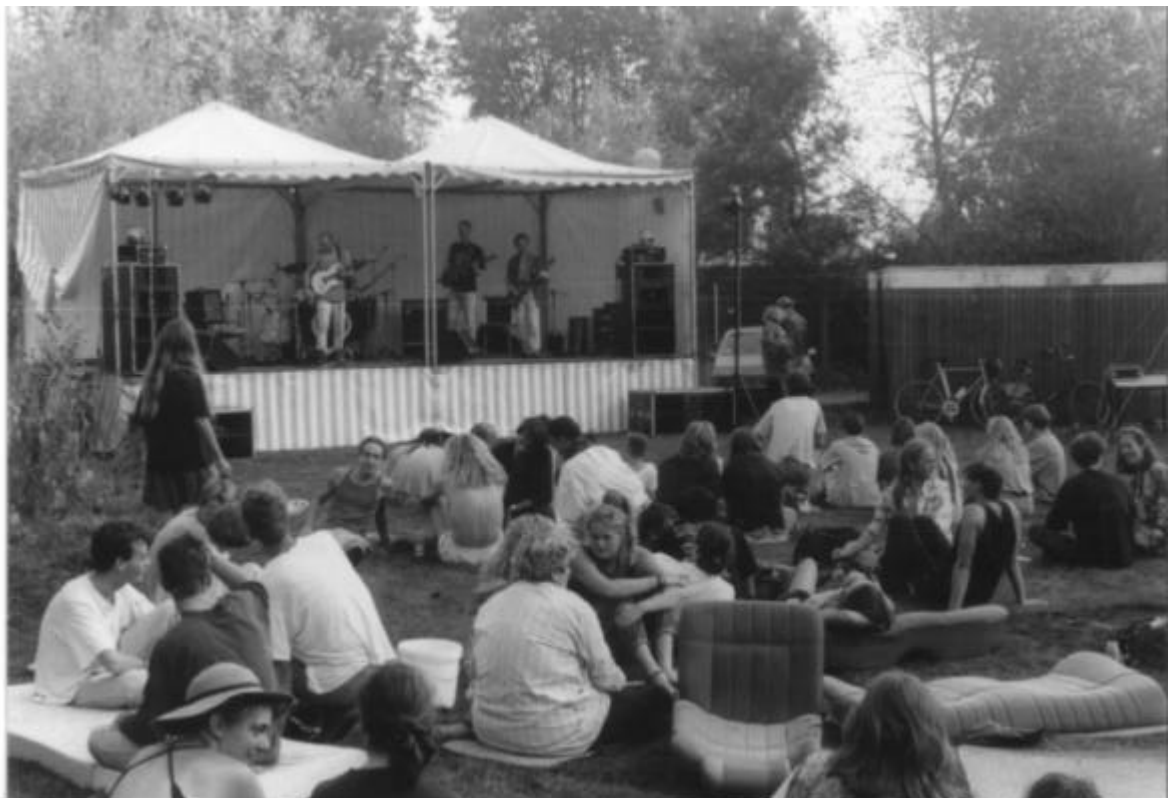
Droef-feest ter ere van het 15 jarig bestaan in 1992.